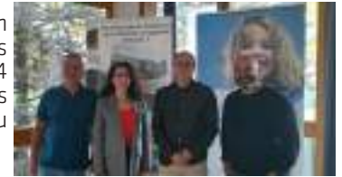
L'équipe PEP CBFC - EHCO lors de la réunion partenariale du 24 septembre 2024

Une réunion de présentation de MAJ'Avenir aux partenaires locaux s'est tenue le 24 septembre. Nous souhaitons une belle réussite à ce beau projet coopératif !